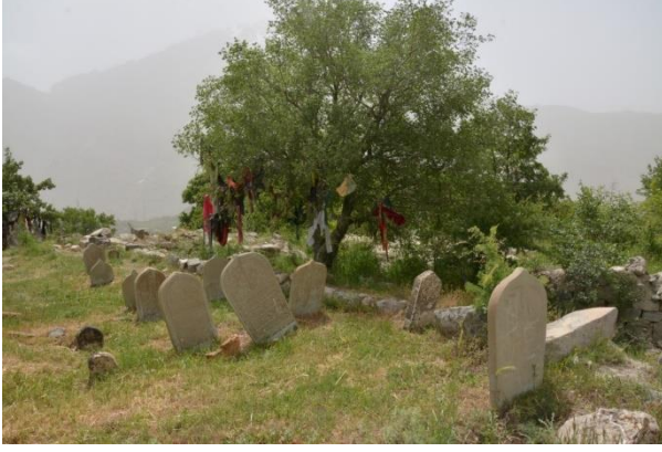
Resim 7: Kızıl Kümbet/Gumbeta Sor Medresesi 10. Hakkâri Meydan Medresesi